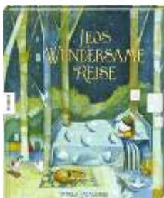
Zagarenski, Pamela Leos wundersame Reise

Eins, zwei, drei: Hier kommt die Rattenpolizei! Leseratte Otilie wohnt in der Buchhandlung von Frau Rübezahl. In einem der Bücherregale hat sie es sich in ihrer Hängematte gemütlich gemacht. Sie liest und reimt, baut Kunstwerke aus Büchern und hat ein wachsames Auge auf ihre Lieblingsgeschichten. Eines Tages betritt ein zwielichtiger Mann den Laden. Otilie wird aufmerksam. Und richtig! Das gibt es doch nicht! Der Mann versucht tatsächlich, Bücher zu stehlen. Aber Otilie ist schneller. Mit Hilfe ihrer selbstgebauten Rattenstolperfalle stellt sie den Dieb.