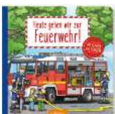
Haag, Marie Heute gehen wir zur Feuerwehr!

Rums und Kawumm, im Wald geht was um! Schnell verstecken sich die Tiere im Wald, denn sie haben große Angst vor dem Riesen Knurr. Nur drei kleine Mäuse besitzen den Mut, ihn anzusprechen und zu einem Fest einzuladen. Ob das wohl gutgeht?