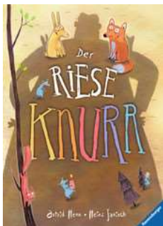
Janisch, Heinz Der Riese Knurr

Rums und Kawumm, im Wald geht was um! Schnell verstecken sich die Tiere im Wald, denn sie haben große Angst vor dem Riesen Knurr. Nur drei kleine Mäuse besitzen den Mut, ihn anzusprechen und zu einem Fest einzuladen. Ob das wohl gutgeht?